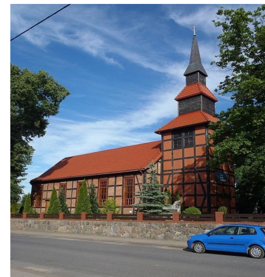
Kościół św. Judy Tadeusza