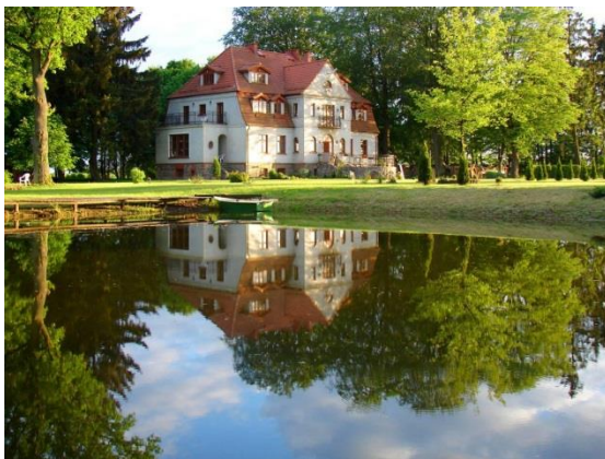
Park dworski w Wilczych Łaskach