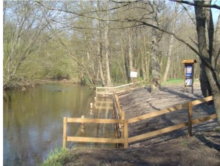
Stacja Kajakowa w Krosinie