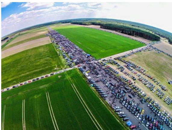
Lotnisko Szczecinek - Wilcze Łaski – Złoty motoryzacyjne