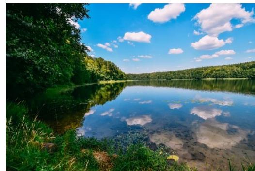
Przełom rzeki Dębnicy