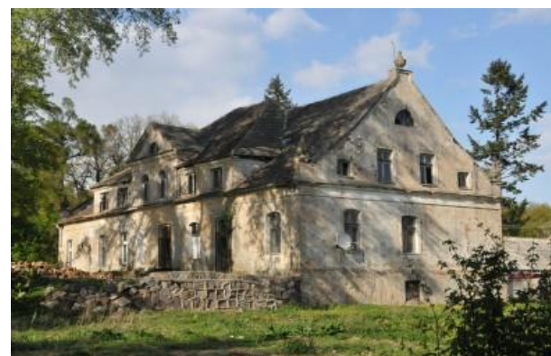
Pałac z II poł. XIX w.