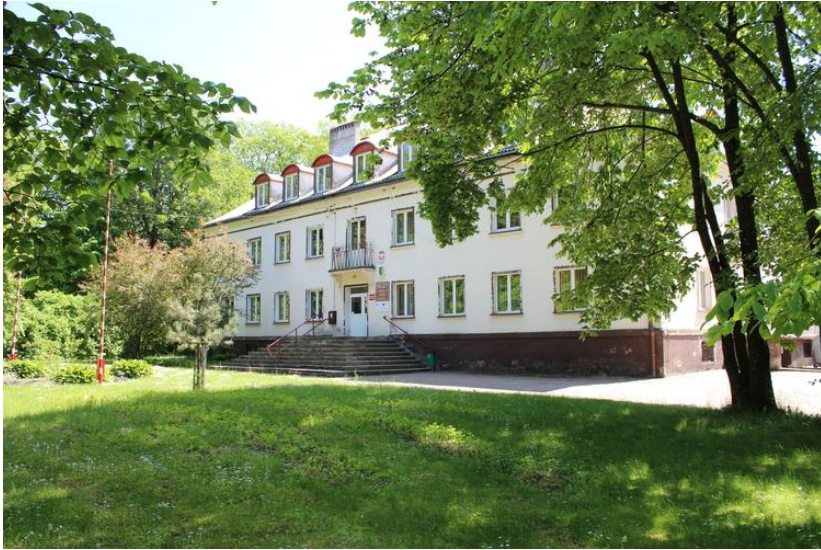
Pałac rodu von Glasenapp